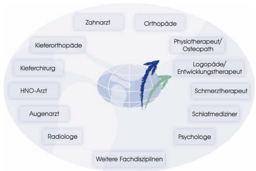
Interdisziplinäre Schnittstellen: Für eine erfolgreiche prothetische Versorgung müssen bei einigen Patienten verschiedene Spezialisten zusammenarbeiten