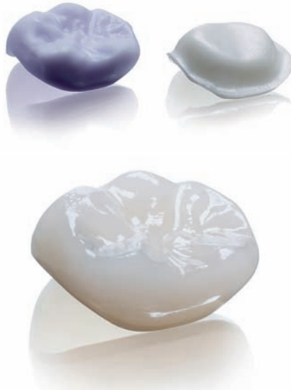
Bei der so genannten Infix-Technologie werden Gerüst und Verblendung über die Software optimal aufeinander abgestimmt und im Fertigungszentrum mit Glaslot verklebt

Die Genauigkeit digitaler Scans, die im Labor von Modellen oder Abformungen hergestellt werden, hängt nach einer aktuellen In-vitro-Studie von deren Geometrie ab [Persson 2009]. Da die Abweichungen jedoch unter 40 µm lagen, ist ihre klinische